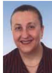
Βασιλική Γκρέκα - Σπηλιώτη

Ομότιμος Καθηγητής Παιδιατρικής Ιατρική Σχολή Εθνικού & Καποδιστριακού Πανεπιστημίου Αθηνών Πρόεδρος Ελληνικής Εταιρείας Παιδικής και Εφηβικής Ενδοκρινολογίας