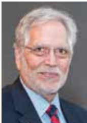
Γεώργιος Π. Χρούσος

Ομότιμος Καθηγητής Παιδιατρικής Ιατρική Σχολή Εθνικού & Καποδιστριακού Πανεπιστημίου Αθηνών Πρόεδρος Ελληνικής Εταιρείας Παιδικής και Εφηβικής Ενδοκρινολογίας