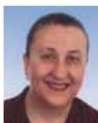
Βασιλική Γκρέκα-Σπηλιώτη Γενική Γραμματέας