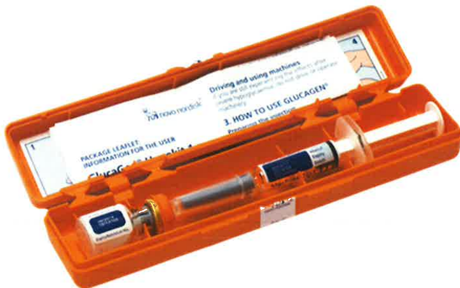
Σχήμα 2. GlucaGen® HypoKit

Το GlucaGen® HypoKit απεικονίζεται στο Σχήμα 2, στο οποίο περιέχονται ένα φιαλίδιο με λυοφιλοποιημένη γλυκαγόνη (1 mg) το οποίο συσκευάζεται μαζί με μια έτοιμη για χρήση προγεμισμένη σύριγγα Στείρου Ύδατος για Ενέσιμα.